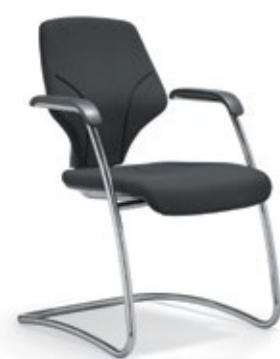
F5 46L x 46 - 47P x 91A