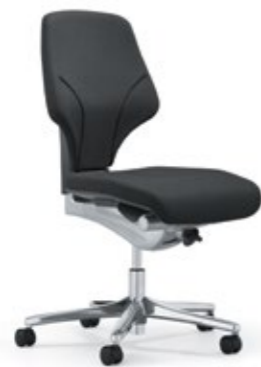
F6 41-44L x 45-47P x 93-112A