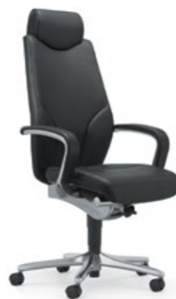
F9 45-47,5L x 51P x 119-138A