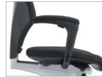
Apóia-braços regulável na altura e na largura para os modelos de encosto alto ou médio.