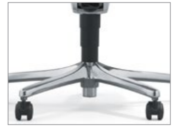
Base em cinco pés de alumínio polido ou com acabamento em epóxi.