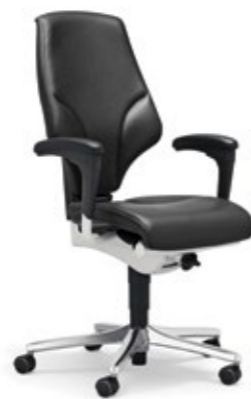
F8 41-44L x 45P x 101-120A