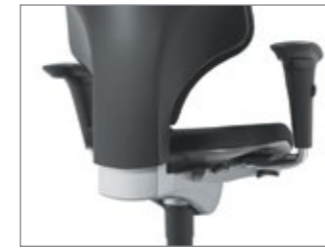
Ajuste de altura e profundidade do assento e do encosto.